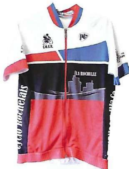
Année 2017 ...