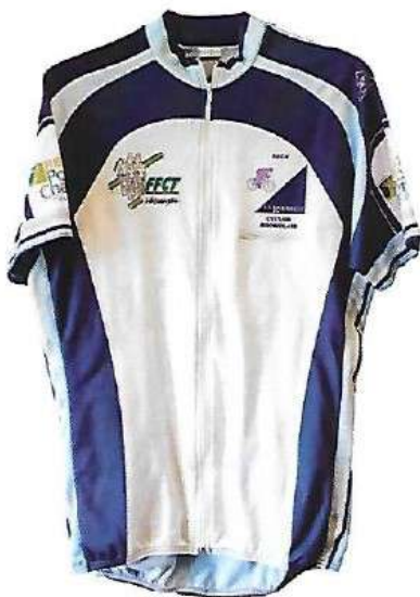
Années 2008 - 2017