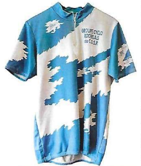
Années 1980 - 1990 - 2000