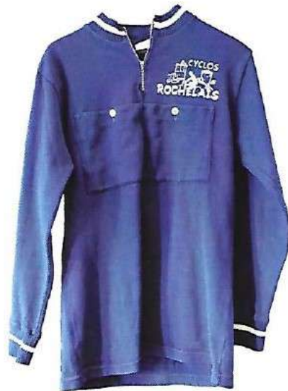
Années 1970 - 1980