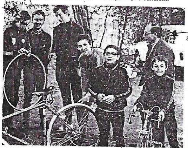
Le test mécanique.

les jeunes de leur participation, les adultes qui ont assuré les contrôles, les responsables du foyer Le Logis, et les personnalités ci-dessus nommées qui ont pris un vrai contact cyclotouriste, dans une discipline sportive à la fois sportive et culturelle.