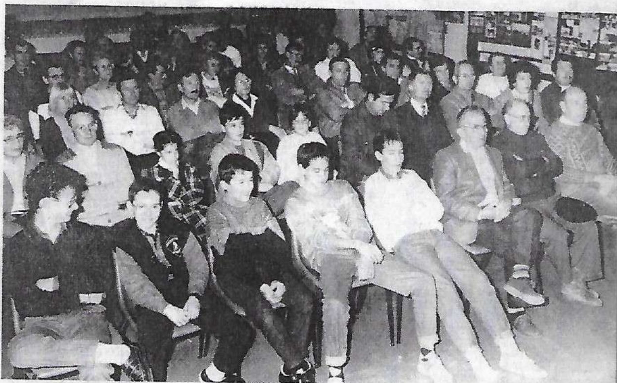
Le cap des 100 licenciés franchi.

Les cyclotouristes rochelais du COSR se sont mis en évidence cette année en remportant le Challenge de la Ligue