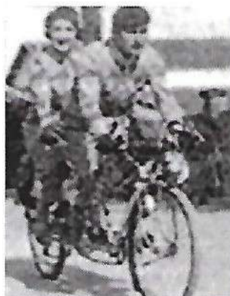
1933 Mr Raoulx